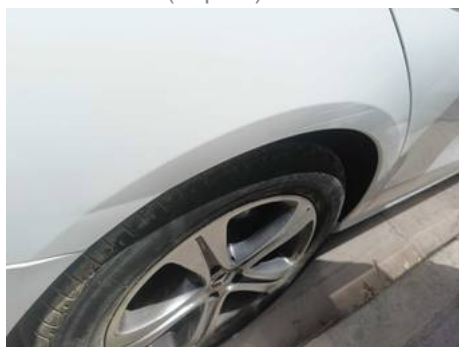
Aile arrière droite (Impact)