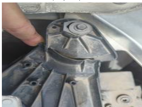
Phare avant droit (Impact)