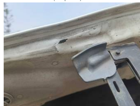
Bouclier avant (Impact)